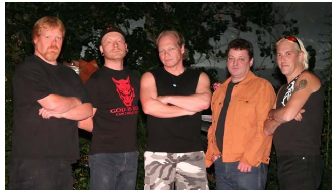
ORPHEUS in heutiger Besetzung