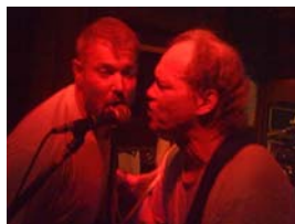
Record-Release-Konzert 2006 im Café Solitaire