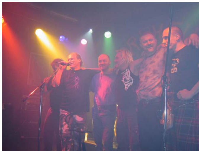
ORPHEUS 2005 im JWD (Berlin-Spandau)

Unzählige Auftritte auf Festivals, Open Airs, in Clubs, Diskotheken, auf Bikertreffen und in kleineren Locations zeigen die hervorragenden Live-Qualitäten dieser Band, die schon als Vorgruppe der Rodgau Monotones spielte und ein beachtliches Repertoire von mitreißenden Stücken hat. Diese Mischung aus Blues- und Folk-Rock, Rock-Balladen und einem Hauch Heavy-Rock hat einen ganz besonderen Reiz. Die Unterstützung durch Dudelsack, Geige und andere Instrumente bereichert den ohnehin schon abwechslungsreichen und vielseitigen Sound der Gruppe enorm.