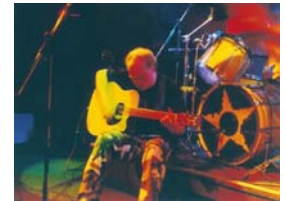
ORPHEUS 2006 im Sound (Berlin-Charlottenburg)

Für weitere Informationen oder Fragen stehen Orpheus kurzfristig zur Verfügung. Außerdem sind auf der Homepage der Band noch mehr Informationen zu finden, z.B. die Biografien der Musiker und eine ausführliche Band-Biografie, eine Liste der anstehenden und der bisherigen Konzerte, unzählige Foto-Galerien und weiteres Pressematerial.